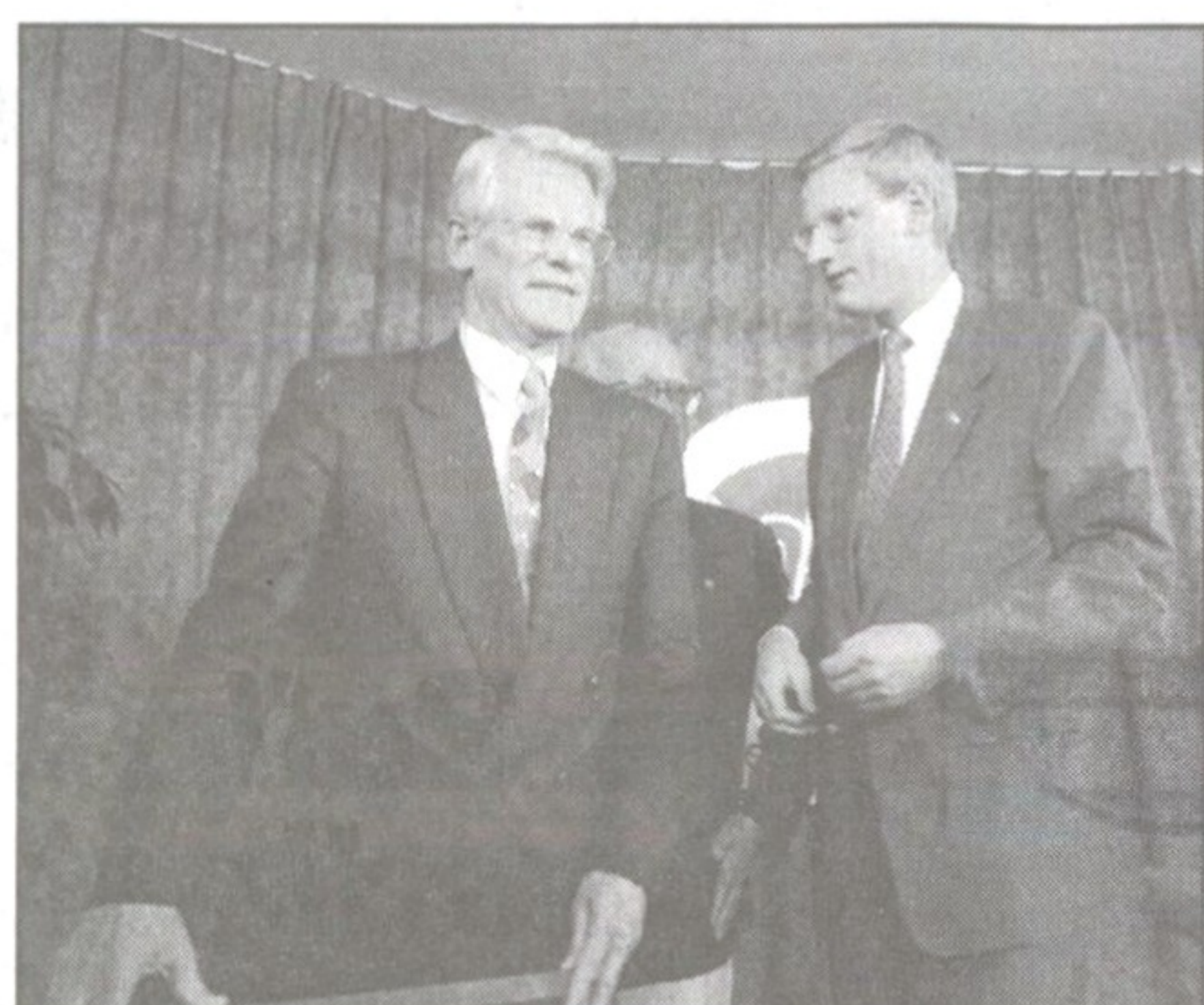
Ingvar Carlsson och Carl Bildt duellerade helt i traditionens tecken.

I stället propaganderade Ingvar Carlsson för mer sysselsättningskapande åtgärder och högre skatter. Det lät som riktigt gammaldags s-politik. Av det nytänkande som faktiskt genomsyrade åtminstone delar