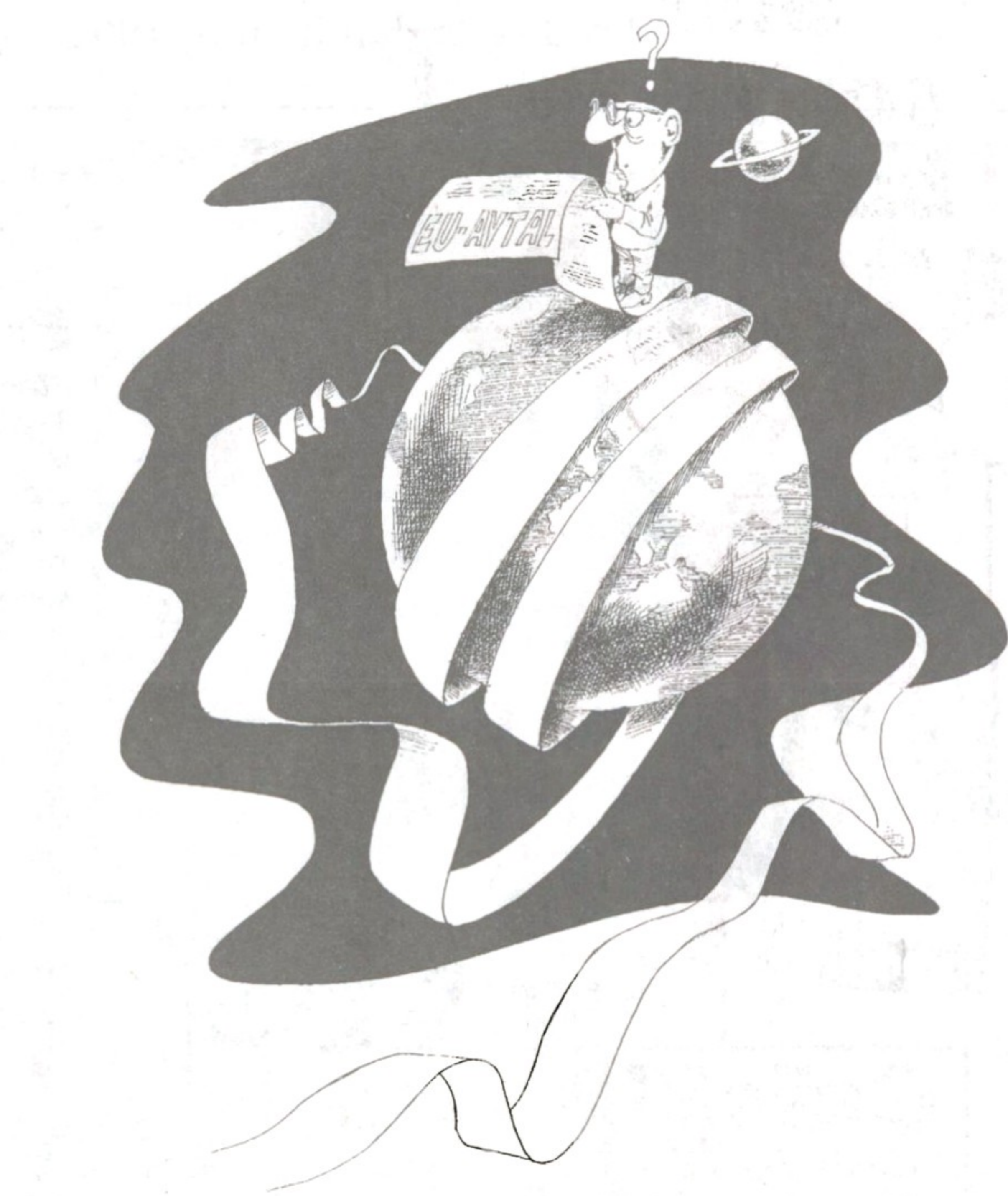
Folkomröstningen närmar sig — nu är reglerna fastställda.

Det är sannolikt att ett första nordiskt ja ger en positiv dominoeffekt i de kvarvarande länderna. Men det är också rent sakligt så att utgången av folkomröstningen i ett nordiskt land innebär en viktig och relevant information för de övriga län-