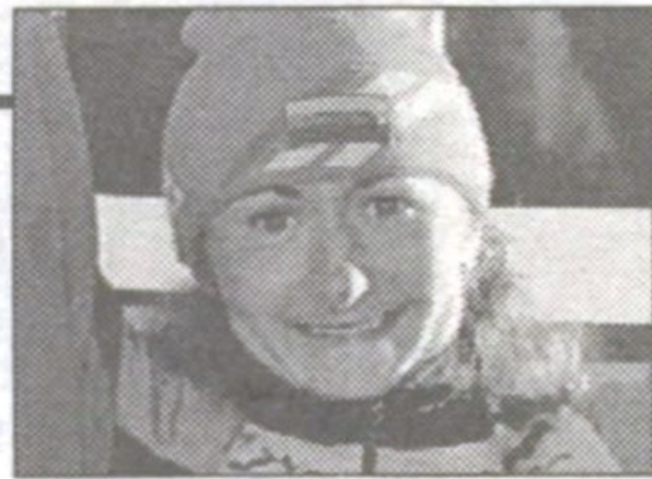
Välbe överlägsen igen.