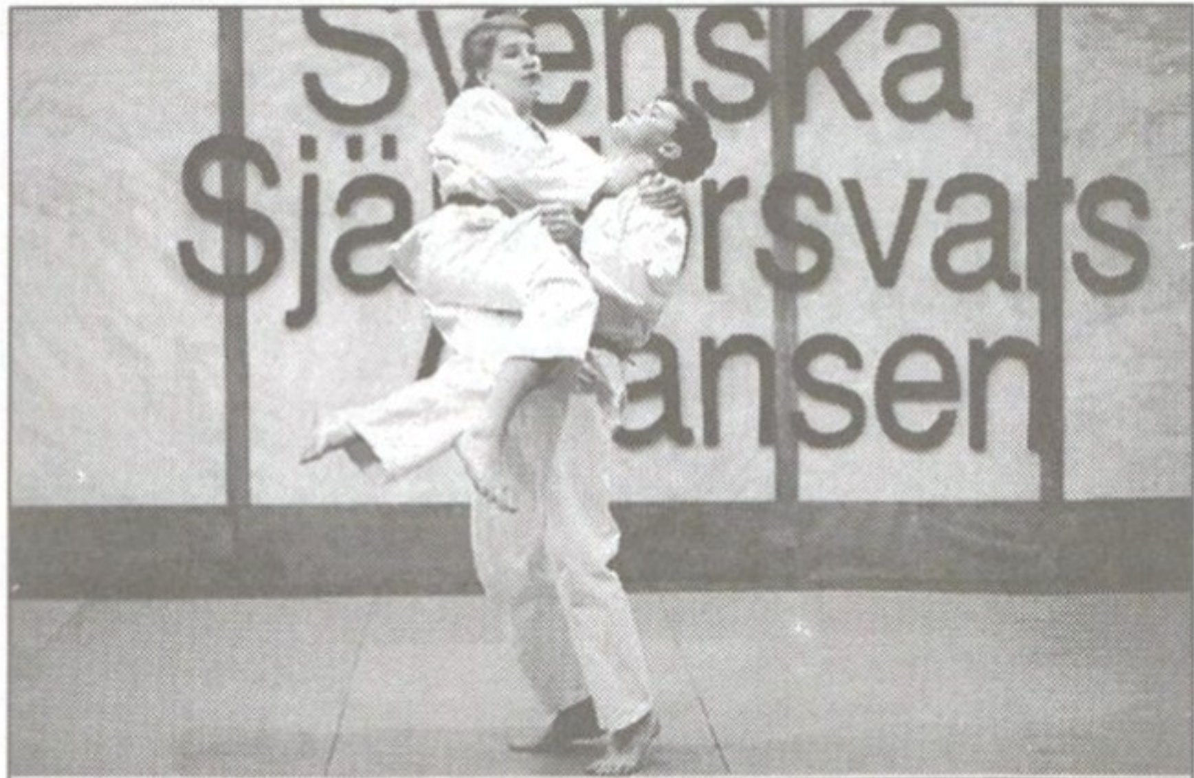
TILL AKTIVIADEN PÅ Älvsjömassan utanför Stockholm kom under lördagen 25 000 besökare. Här kunde den som ville bland annat prova på idrotter som Kendo (kämpfäktning), amerikansk fotboll, bangolf och olika former av självförsvar.