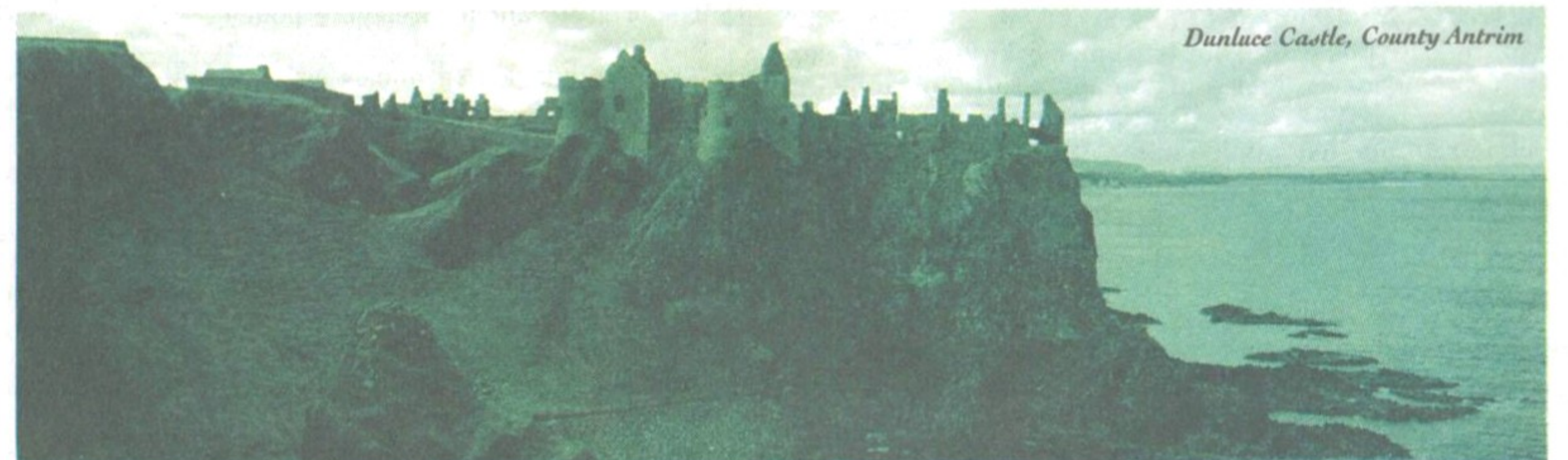
Var du än är på Irland känner du dig alltid lika välkommen