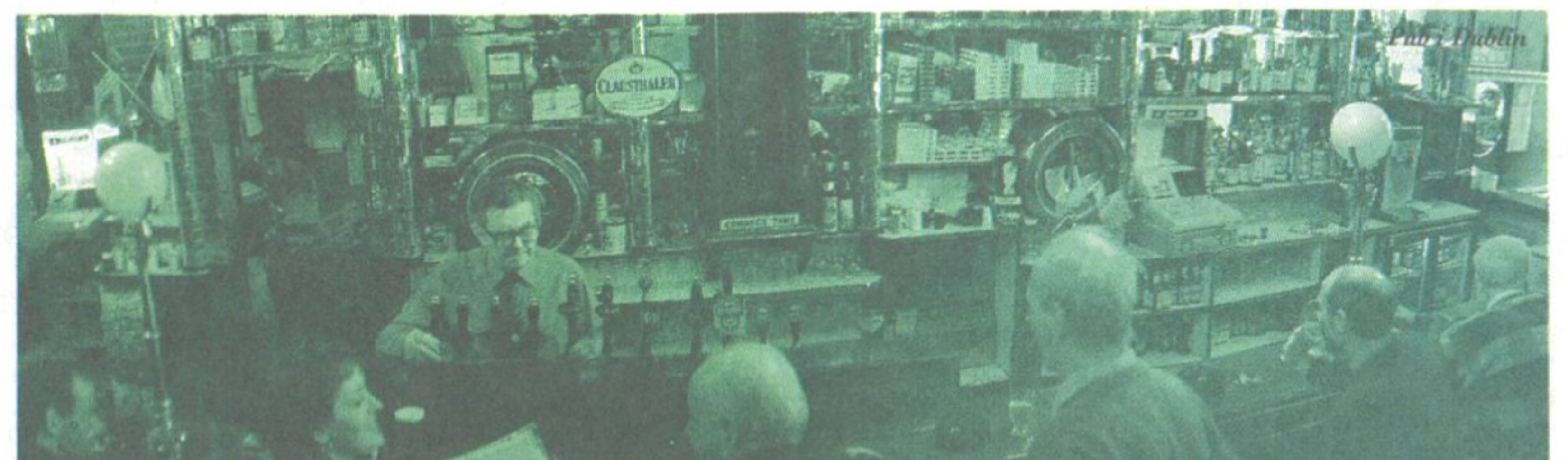
... bara njuta livet i lugn och ro som du själv vill. Irland uppfyller alla dina önskemål.