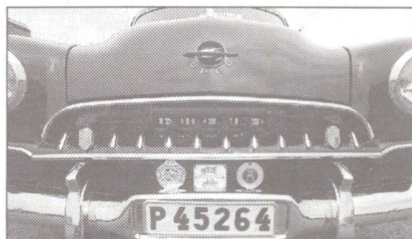
Opel Kapitän – populär tysk på 50-talet.

Men att döma av den strida publikströmmen lär kanske tillfället återkomma nästa sommar.