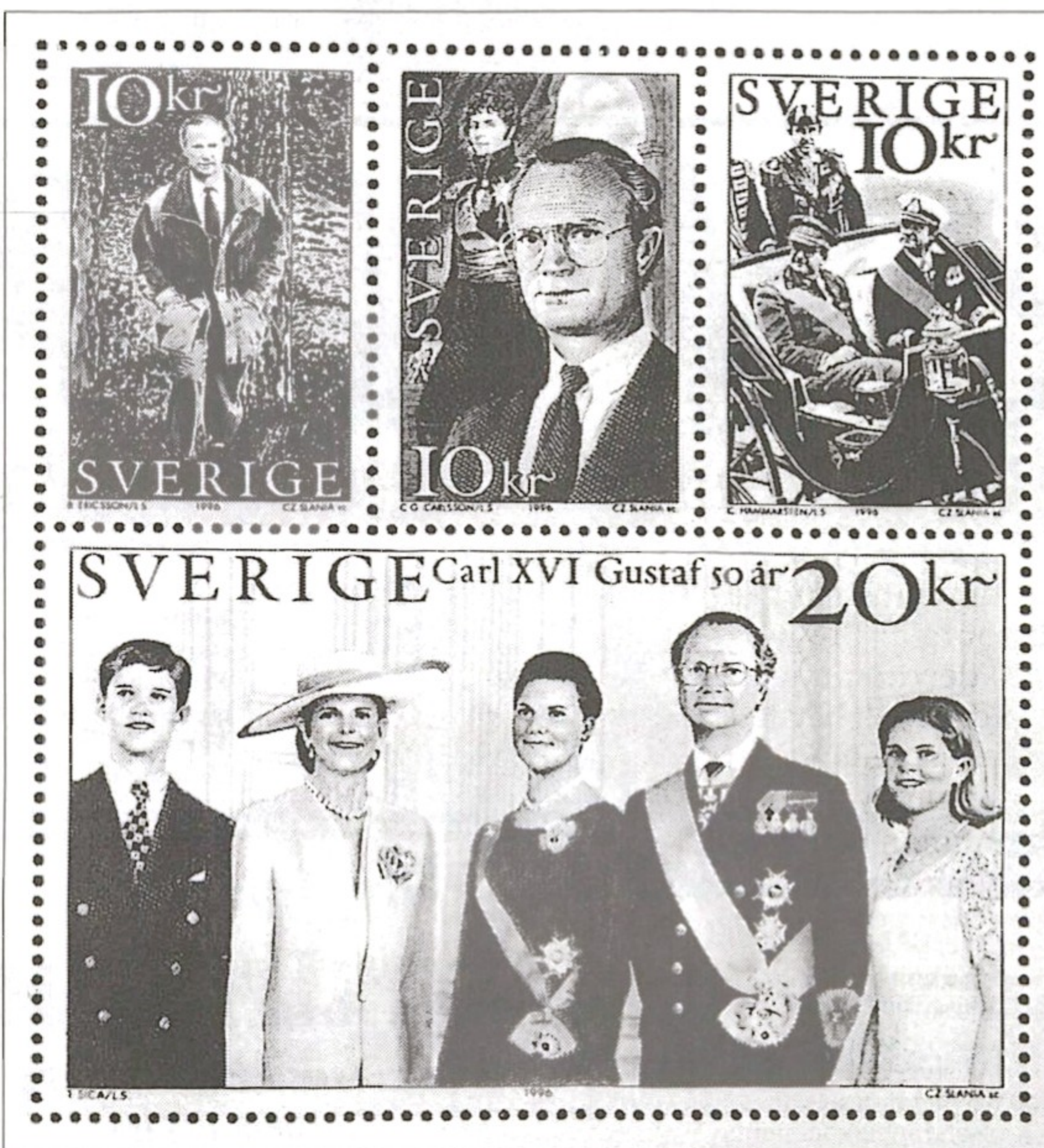
Kunglig gravör. Kungens 50-årsdag till ära har den svenske hovgravören skapat en serie frimärken. Också danska hovet har nu utnämnt honom till hovgravör och Monacos prins Rainier har blivit en av hans vänner.

Det blir mest motiv som visas och bland ungdomarna är det, glädjande nog, mest flickor som ställer ut.