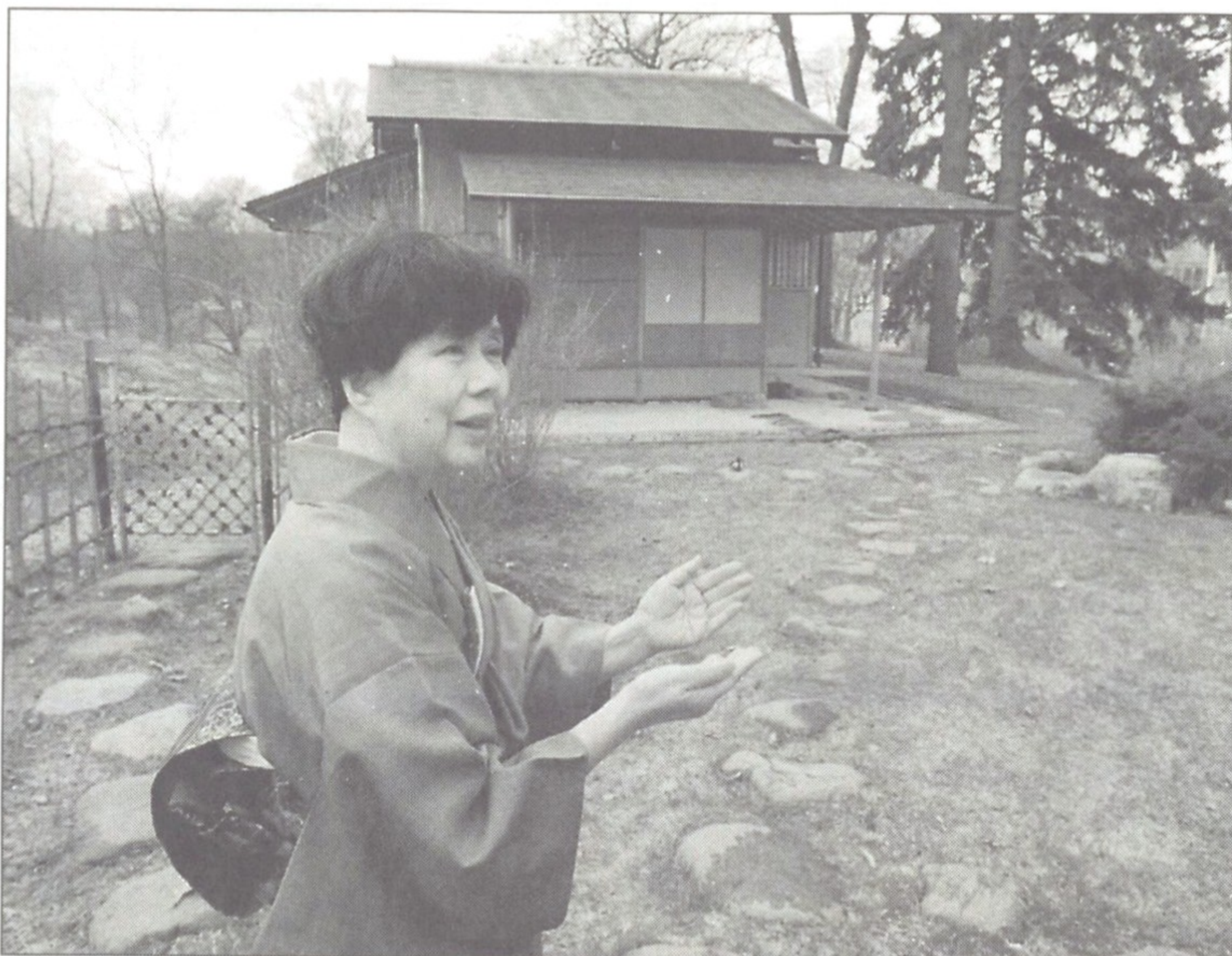
Teets väg. Chado, en konst liksom shodo, kalligrafi. I Det löftrika ljusets boning i Stockholm visar Eiko Duke teets väg.