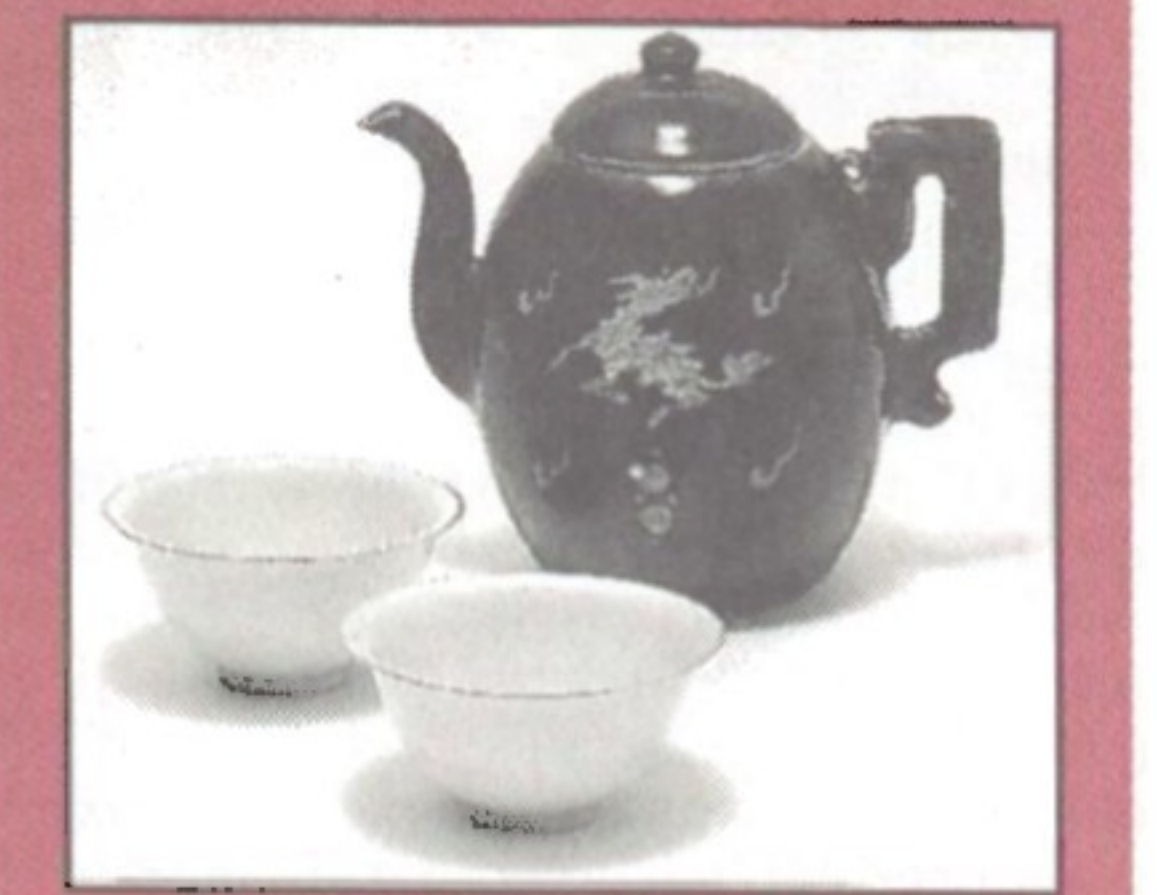
Tekanna med blå glasyr, skålar med vit glasyr. Ming, sent 1500-tal.