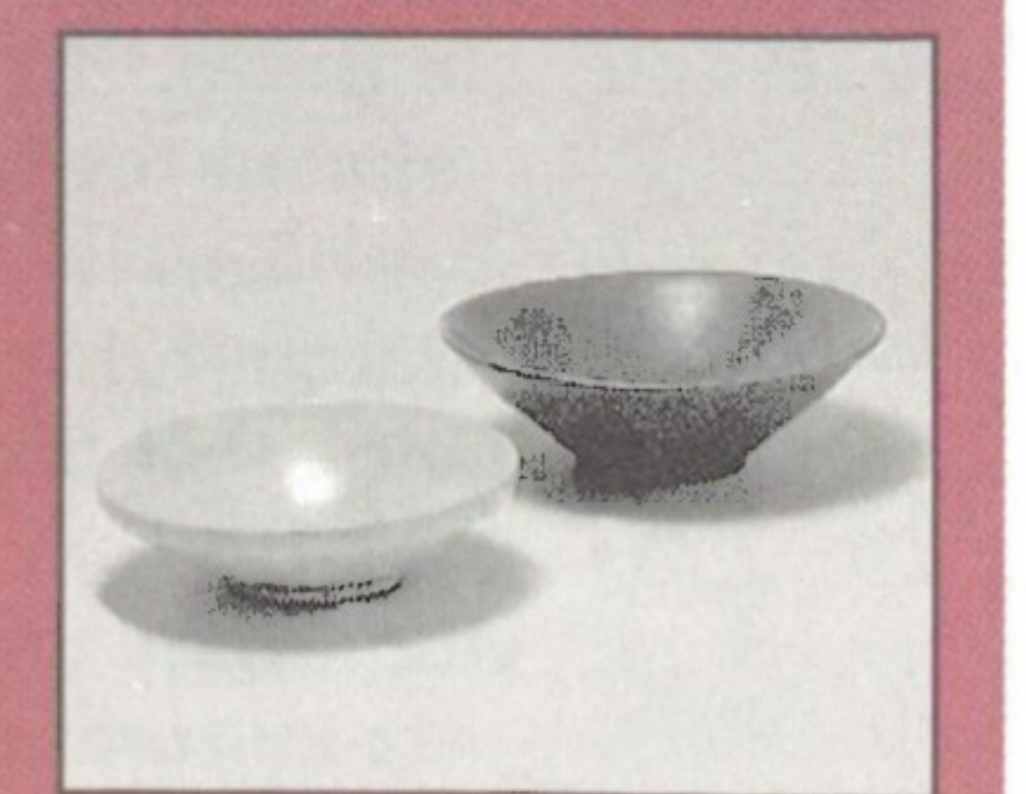
Skålar i stengods. Yue, 900-tal.