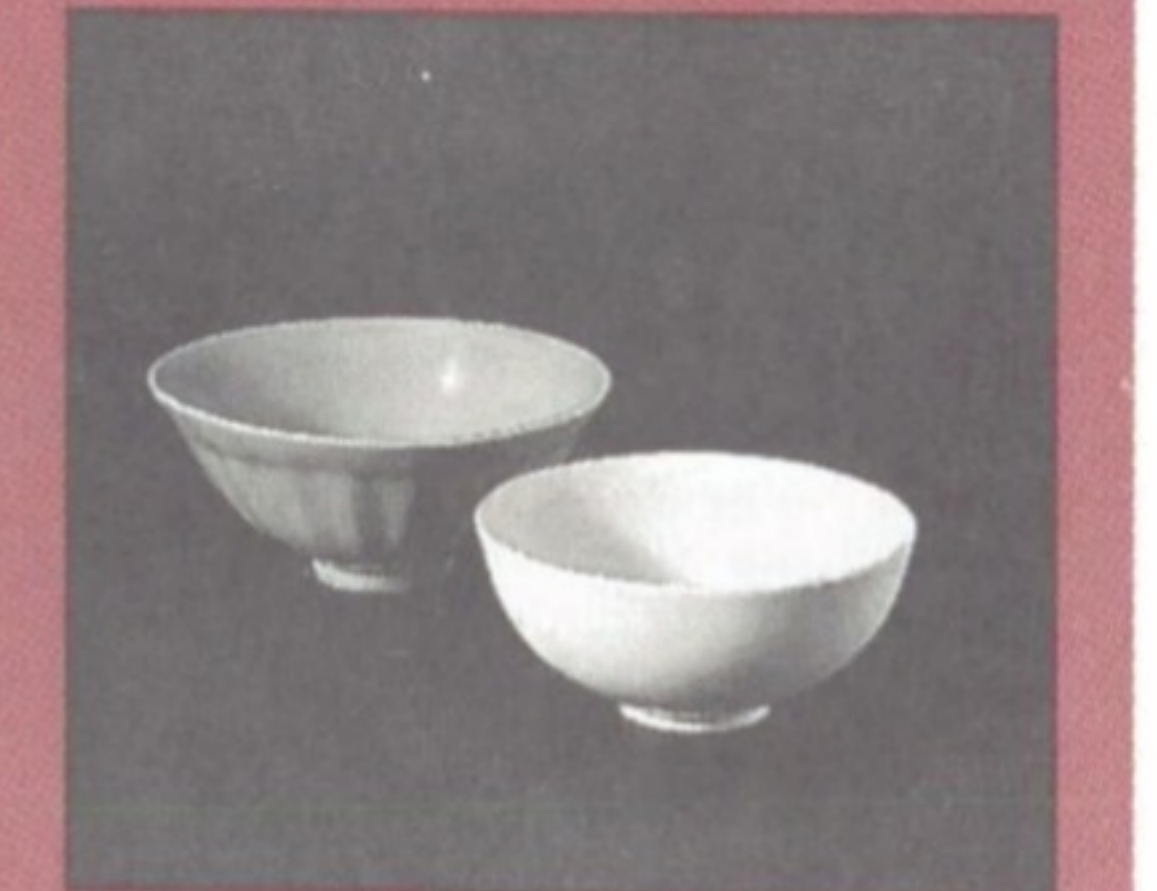
Stengodsskålar, Song-tiden, 875-1200-talen.