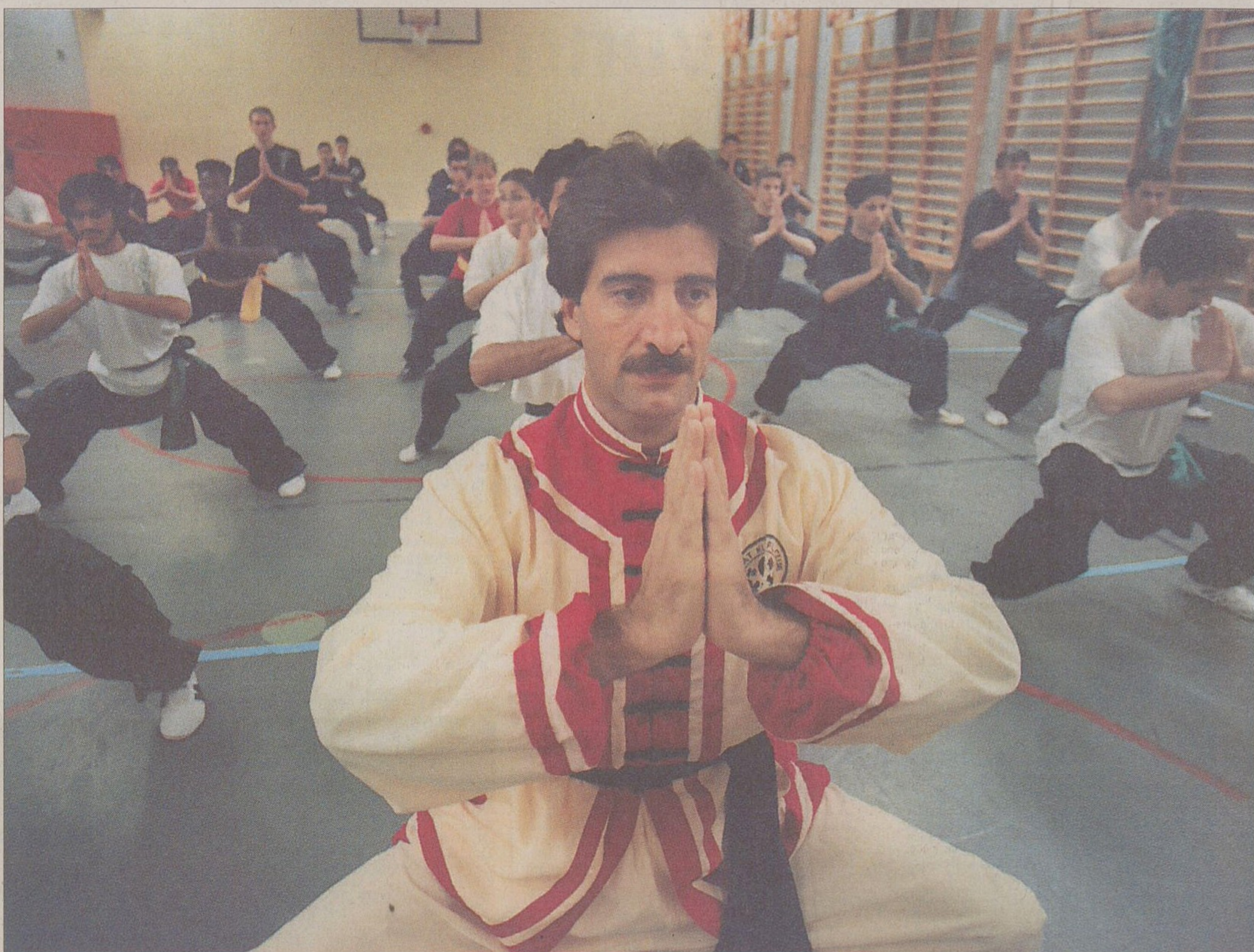
Den som går med i Halmats Kung Fu Club måste vara drogfri och beredd på att uteslutas om han eller hon använder karate ute på gatorna.

Under träningen i Sättras skolan visar Halmats elever upp vad de lärt sig.