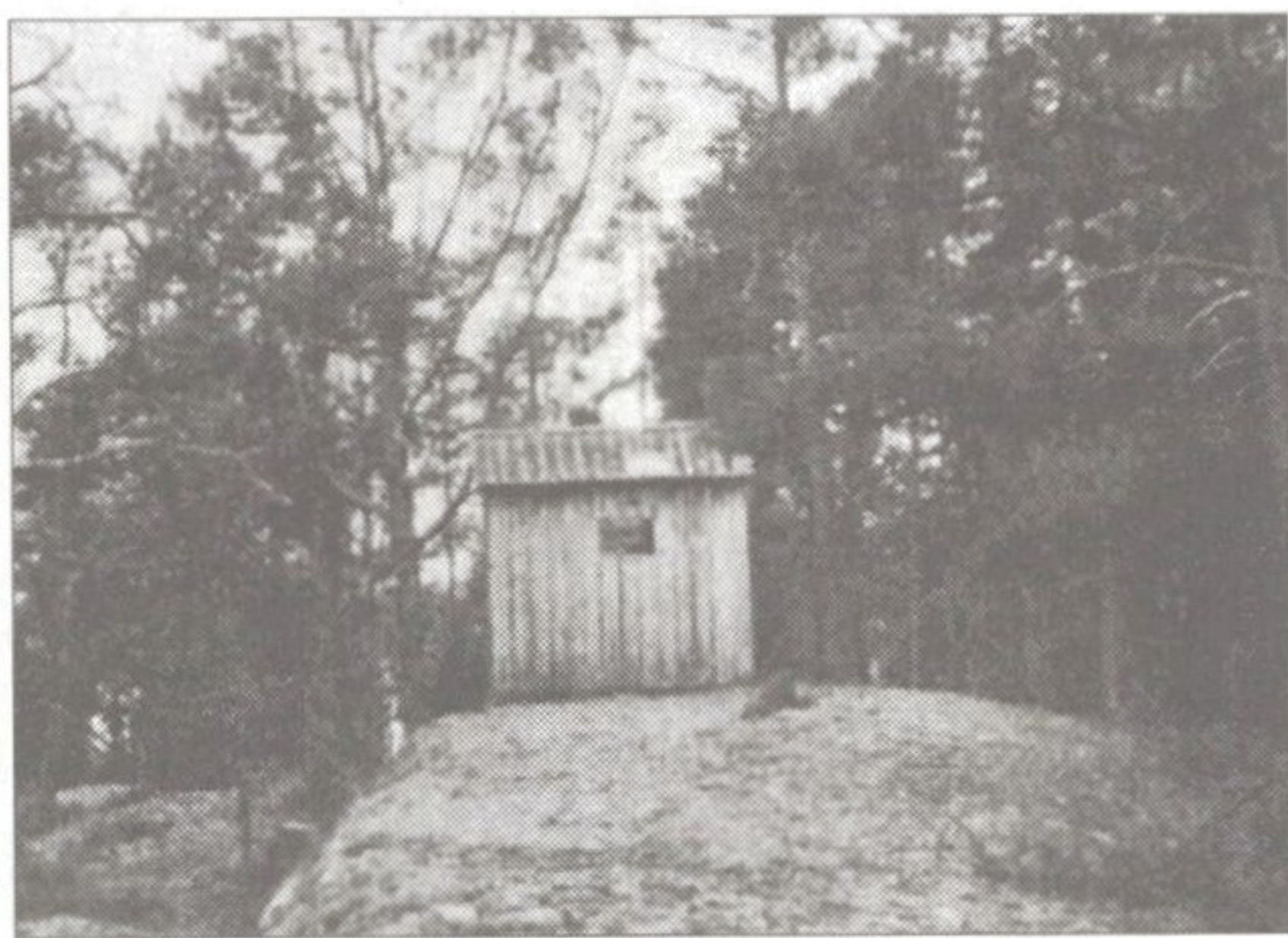
Skriverstugan på Kymendö. Men var det verkligen här som August Strindberg främst höll till när han var i skärgården?

När Strindberg längtade tillbaka fick han hyra in sig på Dalarö somrarna 1891 och 1892. Där hade han varit många gånger genom