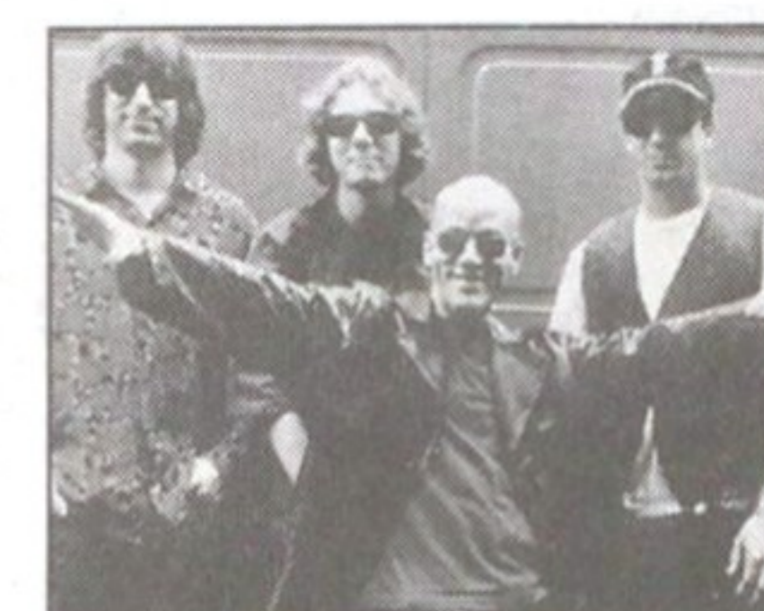
Ny platta på gång.

Wilka som ska ha huvudrollerna eller när filmen beräknas vara klar meddelade inte Bowie. SVD