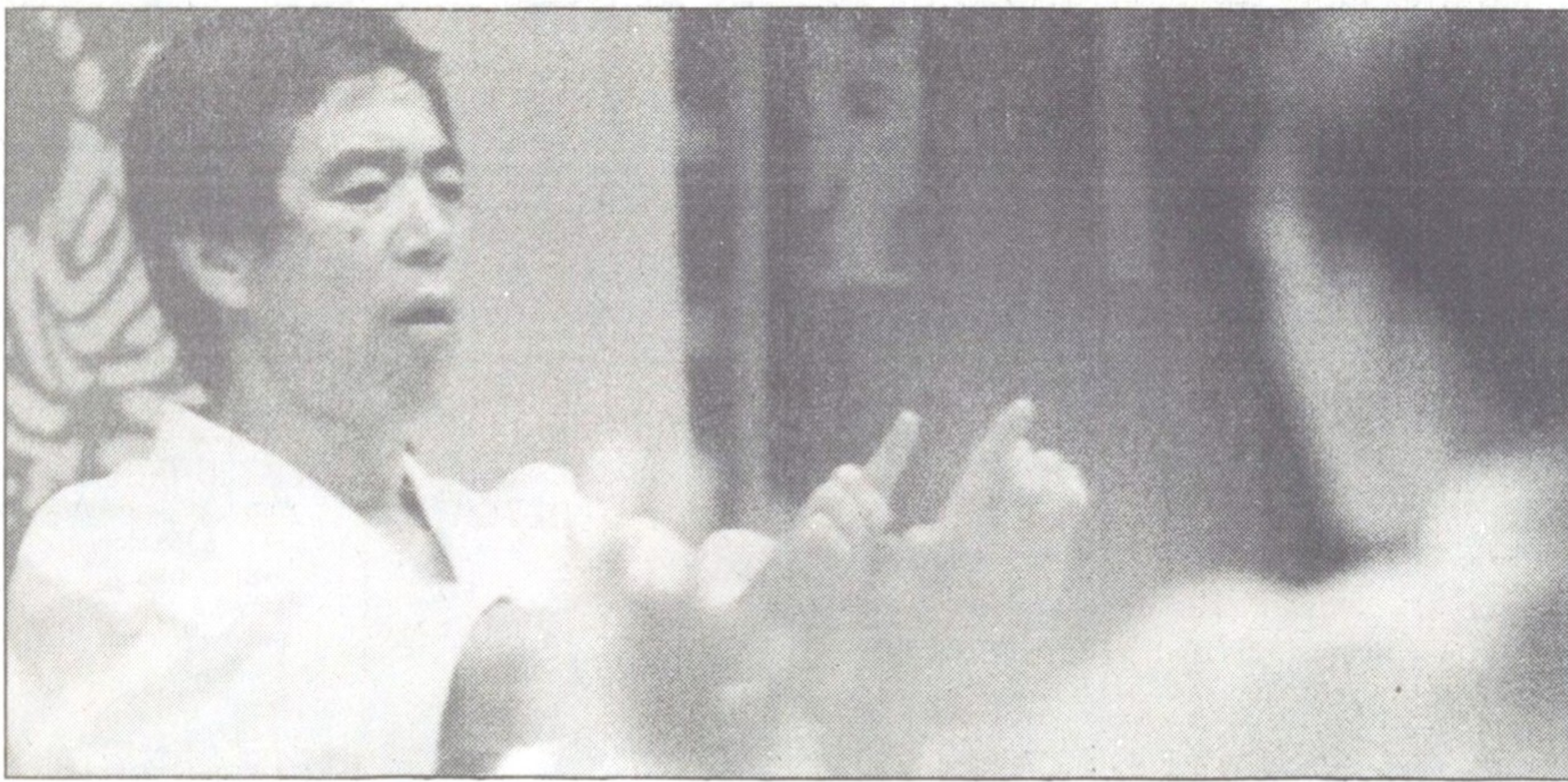
Kraftmätning. Karatens mästare hämtar kraften ur ett behärskat lugn medan katten Fäny föredrar att skrämmas med ett vilt fräsande utspel.

Som den prominenta personen han är laddar han upp i avskildhet i ett eget omklädningsrum i Vällingbyhallen. Hans bana inom japanska kampsporter började vid sex års ålder. Han har tränat sumobrottning, judjutsu, kendo för att som 18-åring börja med